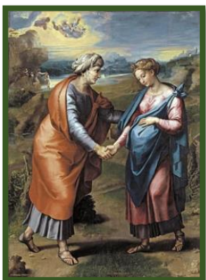
Visitation de Raphaël (1517) Musée du Prado de Madrid